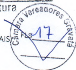
TABELA DE VENCIMENTOS BÁSICOS DO CARGO DE PSICÓLOGO ESCOLAR 30 HORAS (SEMANAIS)